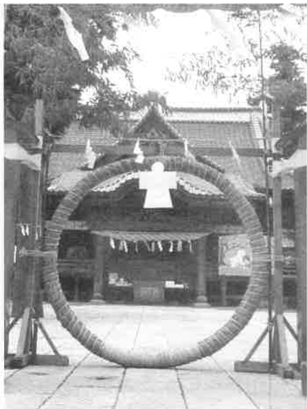
★茅の輪は6月18日より7月10日までくぐる事が出来ます。どうぞ分散参拝にご協力頂きまして、ご参拝ください。